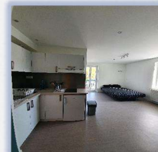
Studio du D2AS