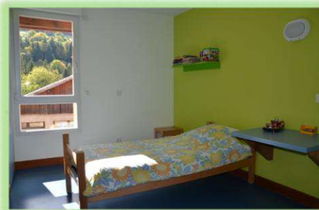
Une Chambre individuelle