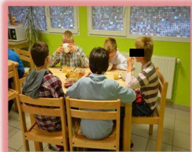
Une salle de repas

L'accueil de nuit s'inscrit donc dans un projet thérapeutique.