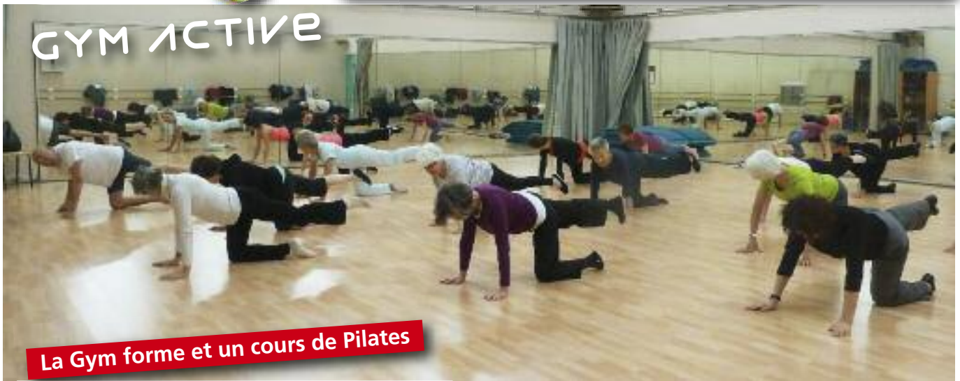
La Gym forme et un cours de Pilates

A près de nombreuses années de pratique de Gym Forme, la section, depuis septembre 2014, s'est diversifiée en accueillant un cours de Pilates le jeudi de 9h à 10h et 10h15 à 11h15 et devient : la GYM ACTIVE.