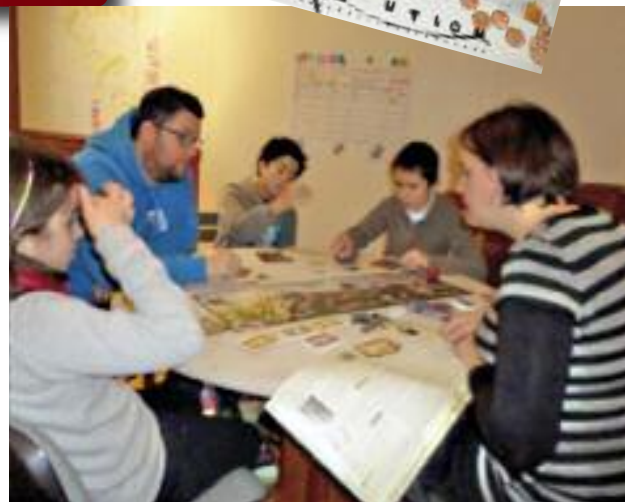
Groupe « atelier jeux » du premier trimestre 2015, et au-dessus, le jeu « Nature vs Pollution » fabriqué par les jeunes de l'Envol en décembre 2014.

En fin de cycle, les enfants s'inspirent de leurs découvertes pour inventer et fabriquer eux-mêmes un jeu qui sera présenté aux familles et partenaires de l'association lors de la journée de fin d'année du Championnet.